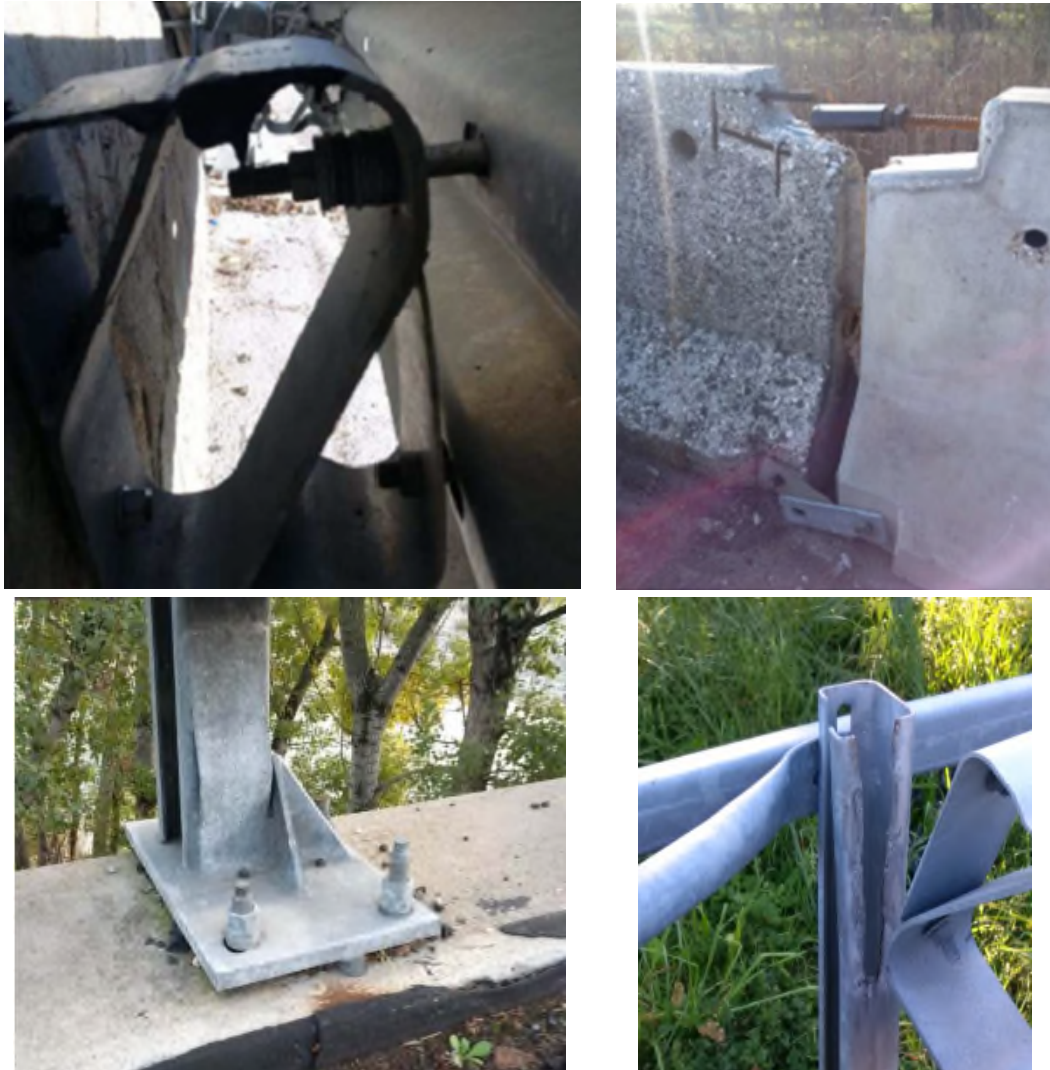
Figura 2 – Esempi di non conformità dei dispositivi di sicurezza