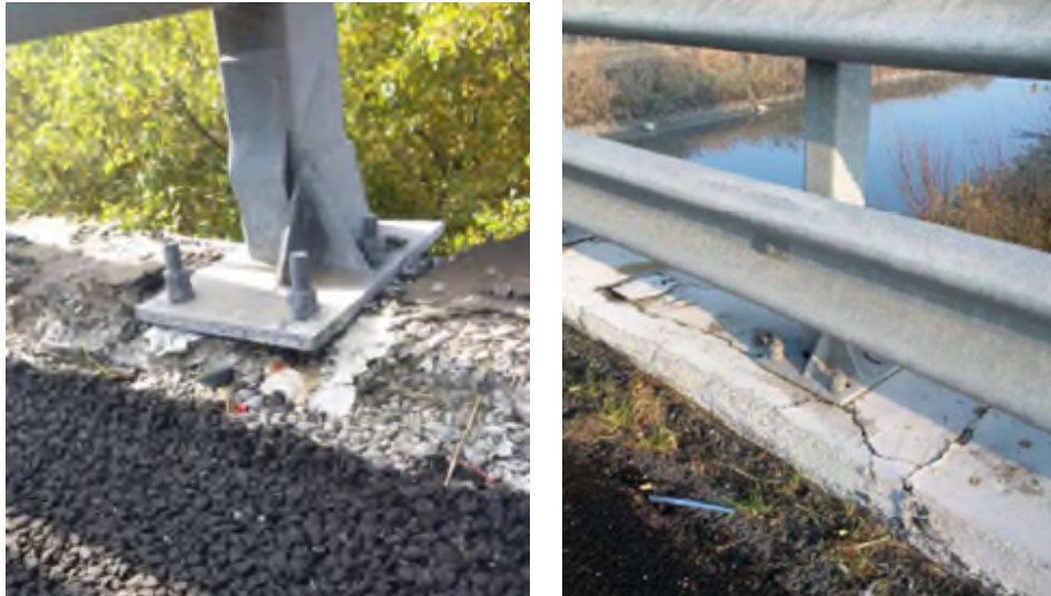
Figura 4 – Esempi di non integrità dei supporti delle barriere di sicurezza.

La constatazione di disallineamenti localizzati attiva un approfondimento immediato attraverso verifica puntuale, secondo le modalità riportate nel paragrafo 3.3.